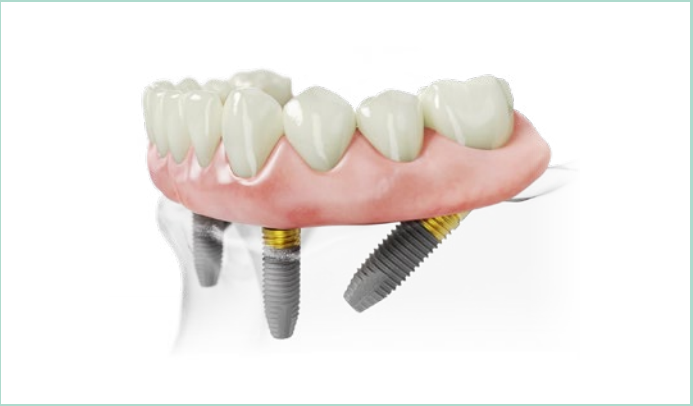
Festsitzende Versorgung mit nur 4 Implantaten