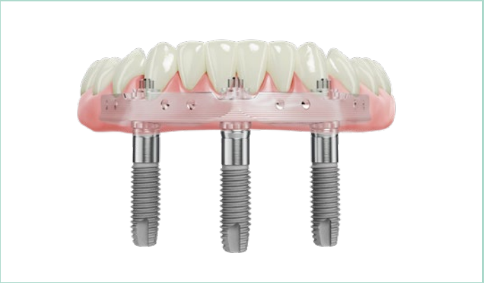
Festsitzende Versorgung mit Implantatsteg