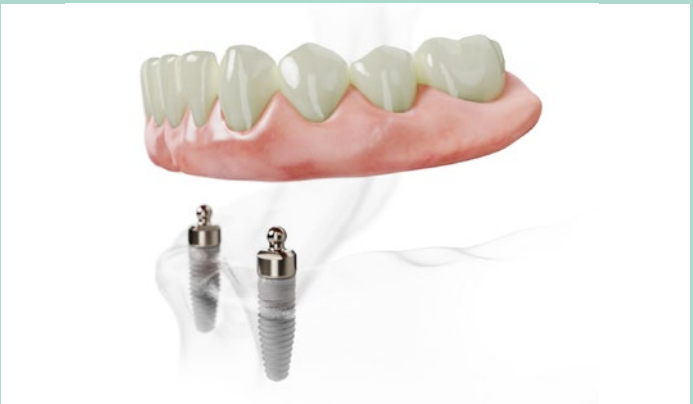
Herausnehmbare Versorgung mit 2 Implantaten